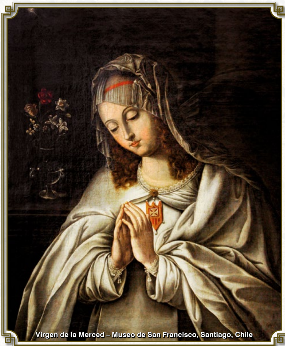
Virgen de la Merced – Museo de San Francisco, Santiago, Chile