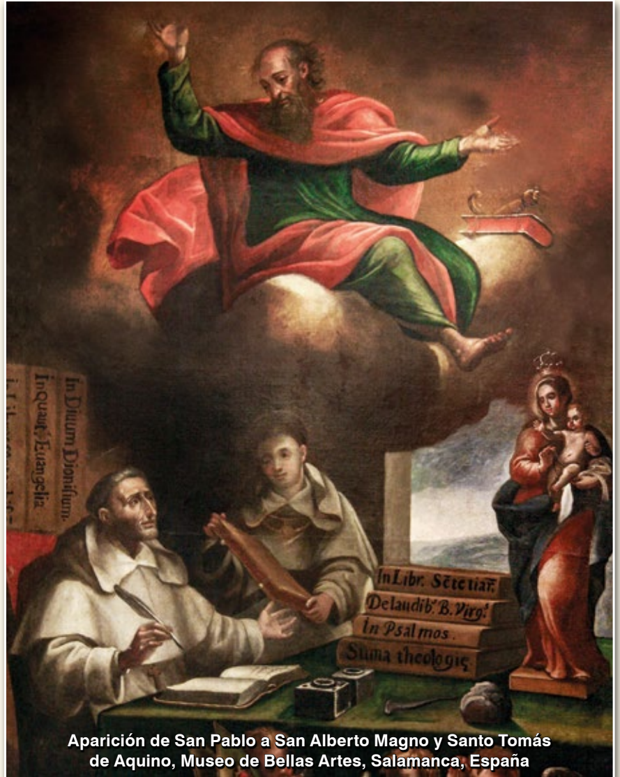
Aparición de San Pablo a San Alberto Magno y Santo Tomás de Aquino, Museo de Bellas Artes, Salamanca, España

Es una paradoja, porque acrecentando debería disminuir el tiempo. Pero en eso que parece una broma,