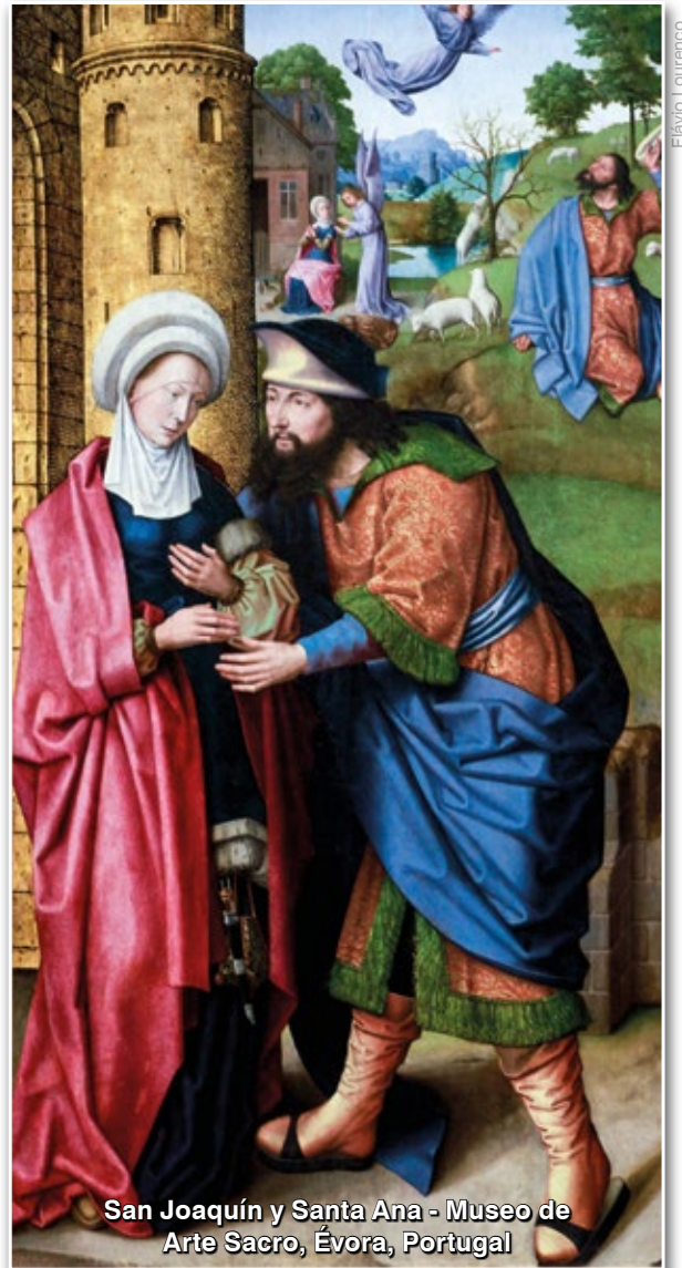
San Joaquín y Santa Ana - Museo de Arte Sacro, Évora, Portugal

Por el contrario, si Santo Tomás se moviese lentamente, sentado en un carruaje empujado por caballos, o montado a caballo, en aquellos largos intervalos ¿no pensaría, no reflexionaría? Evidentemente que sí. Es la ventaja de la espera.