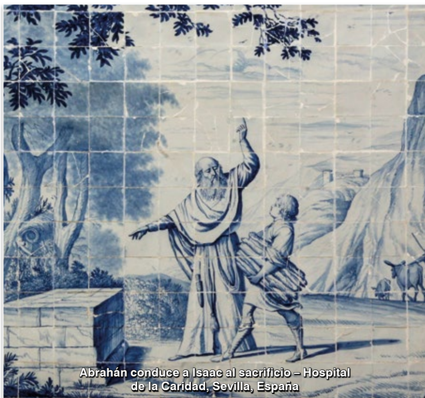
Abrahán conduce a Isaac al sacrificio – Hospital de la Caridad, Sevilla, España