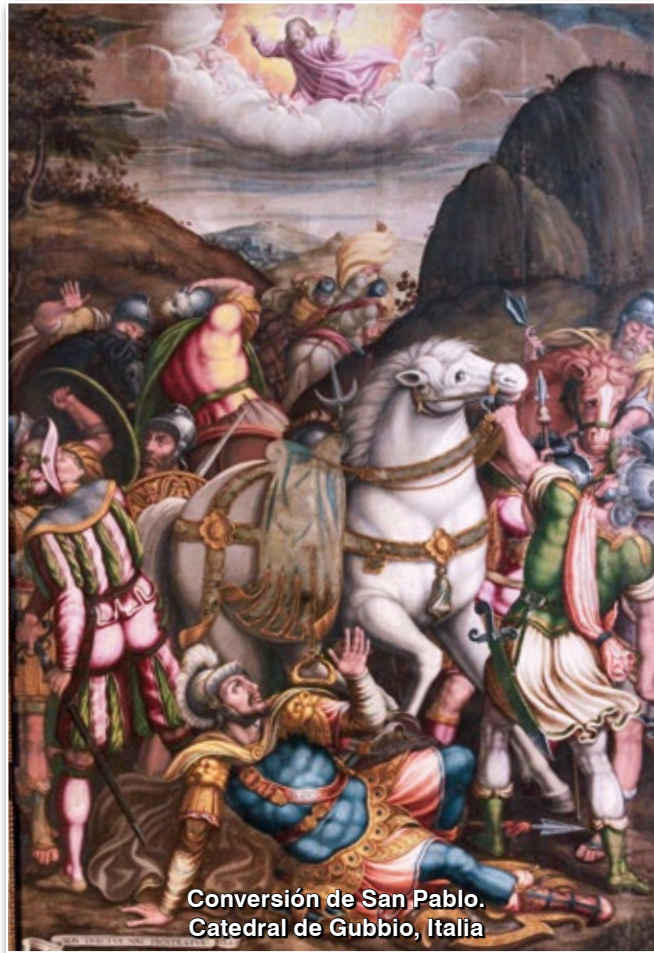
Conversión de San Pablo. Catedral de Gubbio, Italia