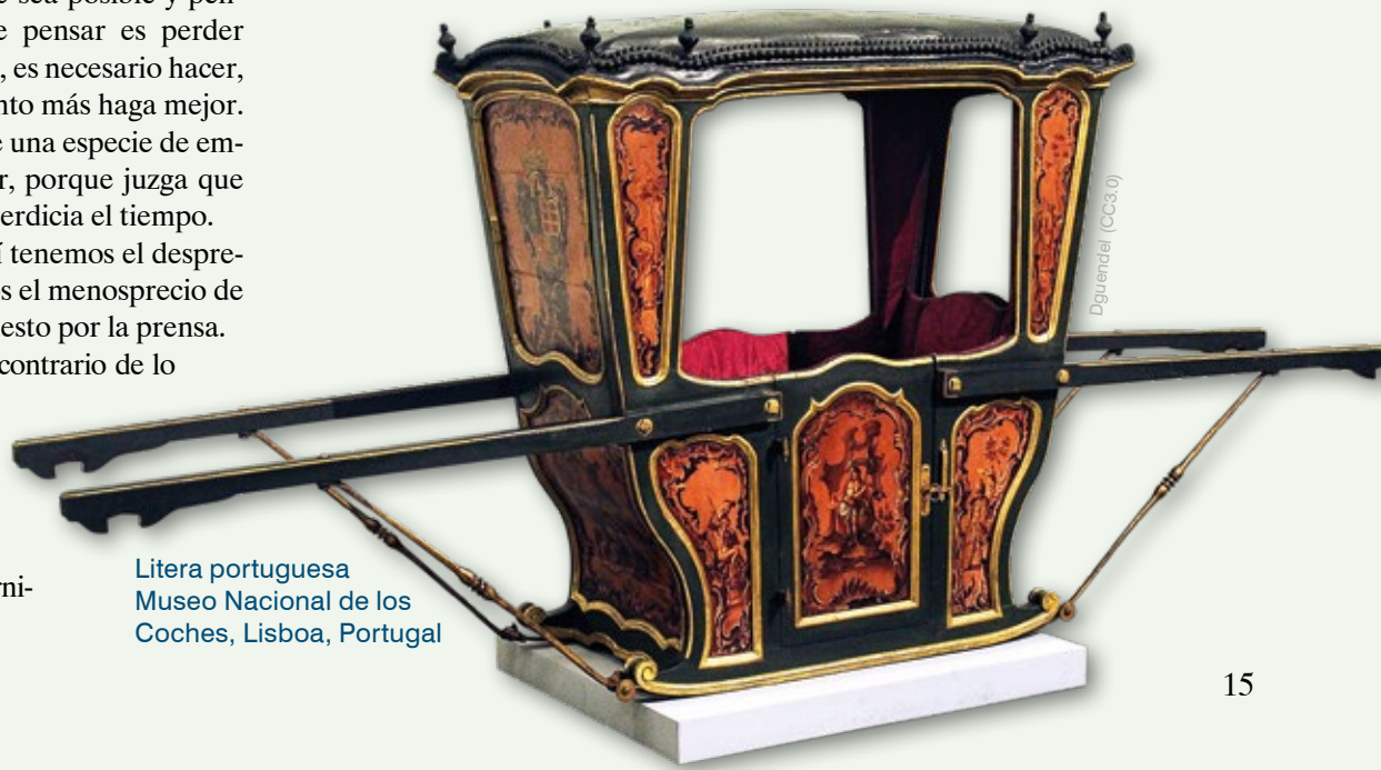
Litera portuguesa Museo Nacional de los Coches, Lisboa, Portugal

Más adelante ( Cf. I-II, q. 3, a. 3 ), Santo Tomás pregunta si los sentidos