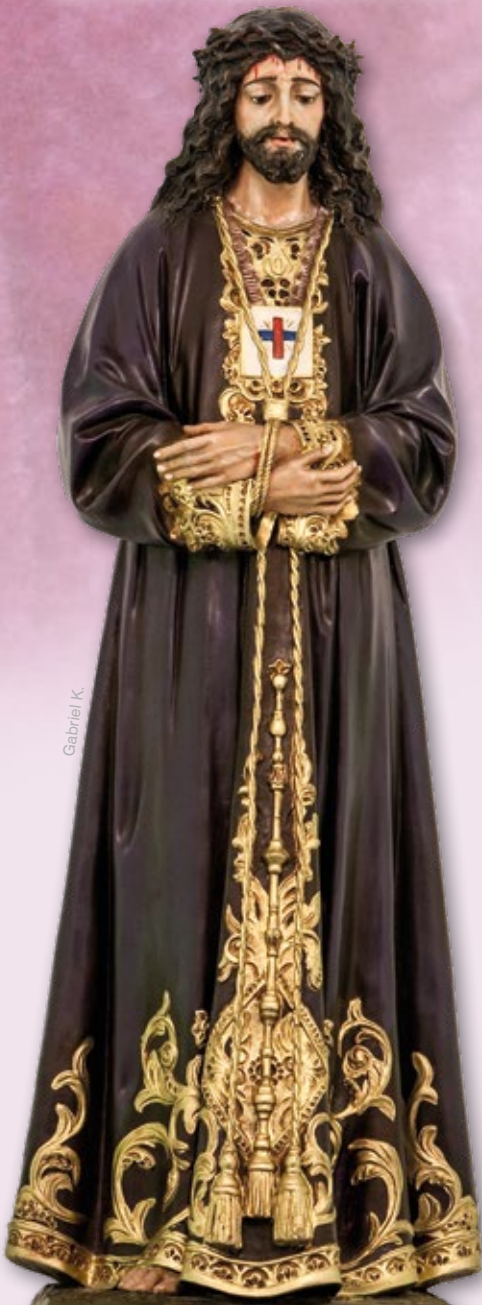
Jesús con las manos atadas (acervo particular)

En una de las últimas veces que estuve allá, la miré y me di cuenta de algo curioso: al contemplar otrora aquel cuadro, aunque me formase de él una idea objetiva, Nuestra Señora ayudaba a mi espíritu de niño a mitificar, a sublimar el cuadro. Y esa sublimación me hizo mucho bien, porque me hacía sentir la gracia venida del Sagrado Corazón de Jesús a torrentes, sobre todo