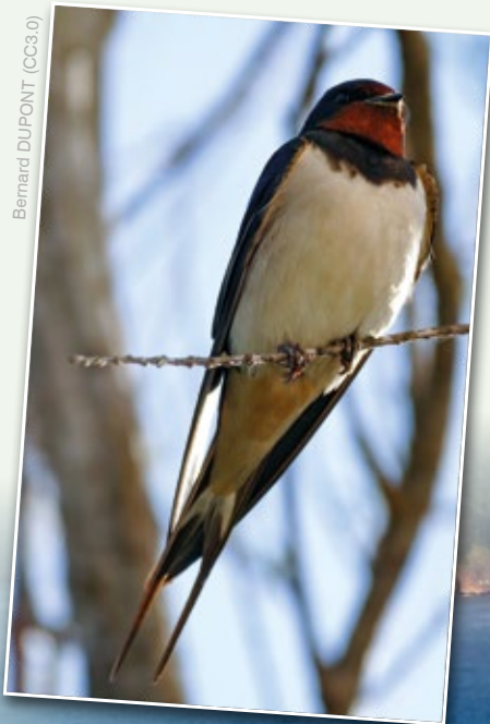
Bernard DUPONT (CC3.0)

Me acuerdo de que mi bisabuelo 1 , siendo diputado del Parlamento