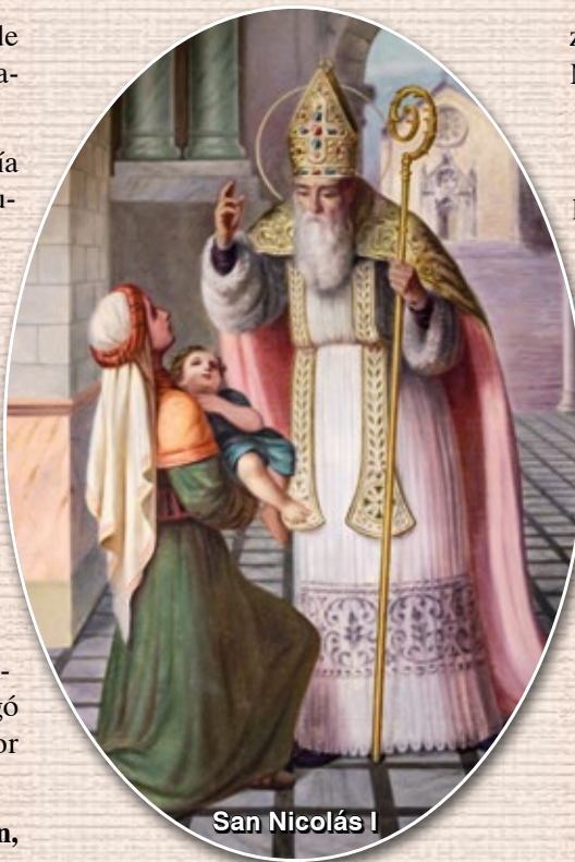
San Nicolás I

Beato Miguel Agustín Pro , presbítero y mártir (†1927). Jesuita fusilado después de una condena sin juicio, en Guadalupe, México, durante la persecución contra la Iglesia.