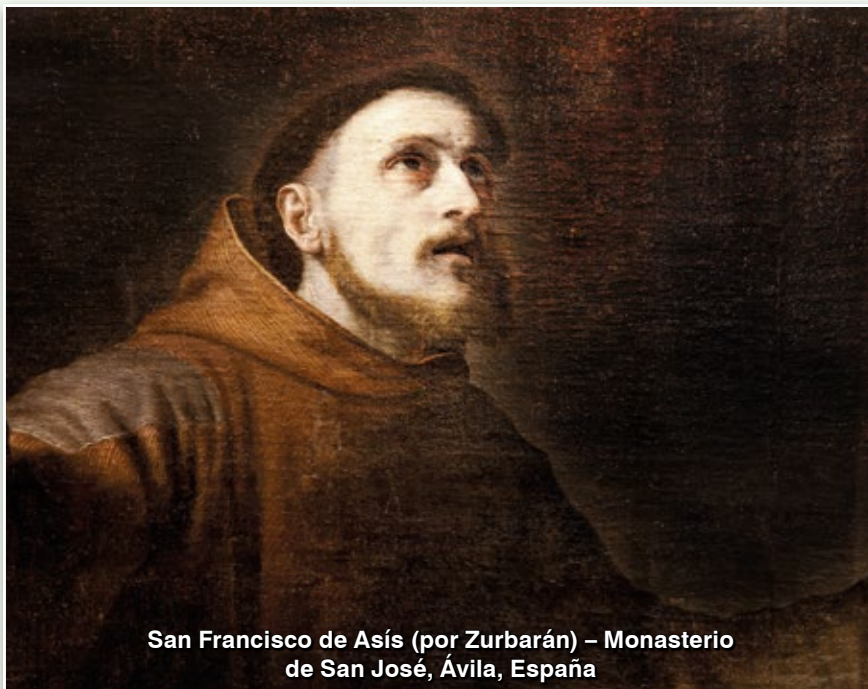
San Francisco de Asís (por Zurbarán) – Monasterio de San José, Ávila, España

El Doctor Angélico cita un principio de Aristóteles que ordena magníficamente el espíritu: “Cada ser es valorado, sobre todo, por lo que tiene de excelente” (Cf. Ethic. , 1.9, c.8, n.6). O sea, si yo quiero conocer bien a fondo un ser, debo apreciar lo que tiene de excelente. Y a partir de ahí explico todo el resto.