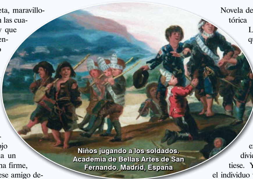
Niños jugando a los soldados. Academia de Bellas Artes de San Fernando. Madrid, España

El niño comienza a fabricar para sí dos mundos: uno interno, que es la búsqueda de alguna cosa que él no tiene, no está a su alrededor, y que necesita alcanzar; y el mundo externo en el cual necesita vivir bien, y con el cual alcanza una consonancia – natural en algunos puntos, artificial en otros –, a fuerza de buscar, de ser amable con los otros y de los otros ser amables con él. Aprendió los trucos de la convivencia. Es, más o menos como quien aprende a conducir un automóvil. Sabe que necesita mirar el espejo, tocar la bocina, apretar con el pie ora el embrague, ora el acelerador, ora el freno, y peda-